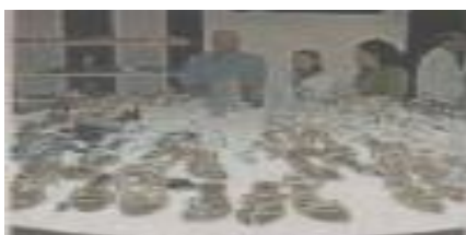
Calzature in esposizione